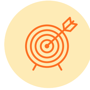
전장 제품 신뢰성 평가