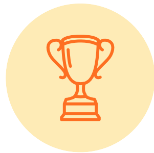
전장 제품 SW 검증

System SW 안정성과 신뢰성 확보를 위한 SW검증/평가, 시뮬레이터 개발과 검증 자동화를 위한 개발등을 수행하며 이에 대한 축적된 경험을 기반으로 자동차 검증 평가 부분에 우수한 경쟁력을 확보하고있는 기업입니다.