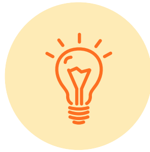
전장 제품 SW 개발