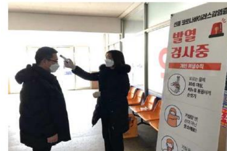
▲ 출처 : '코로나19 막자'...보은군, 군민 3만5천여명 주 1회 발열 체크 (연합뉴스, 2020.02.25)