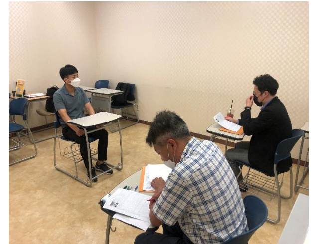
▲ (주)엘리트코리아 오프라인 상담 및 프로그램 사례

단체문자를 통한 코로나19 예방 관련 행동수칙 안내 및 교육시 1m 이상 떨어져서 진행 체온이 37.5도 이상이거나 호흡기 증상이 있는 학생의 경우, 학교 관련부서에 확인 후 격리공간 대기 출입 전 마스크 및 손소독제 확인 후 문진표 작성하고 출입