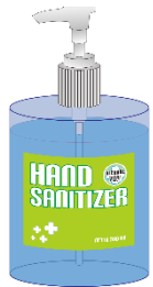
▲ 손 소독제