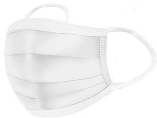
▲ 일회용 마스크