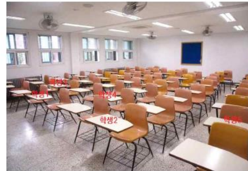
▲ 강의실 지정좌석제 실시 (예시)