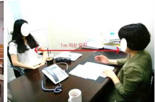
▲ 컨설턴트와 대면 시, 1m 이상 떨어져서 진행