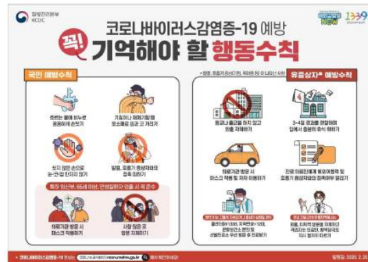
▲ 질병관리본부 코로나19 예방 수칙 포스터