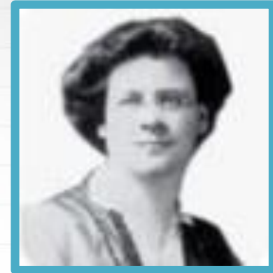
Katharine Cook Briggs