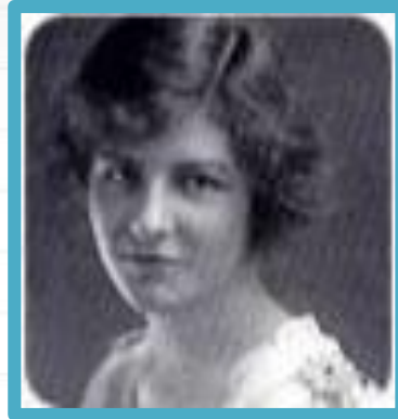
Isabel Briggs Myers